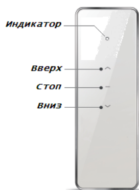
Пульт 1-канальный DC1700