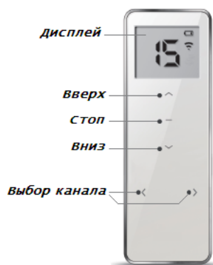
Пульт 15-канальный DC1702