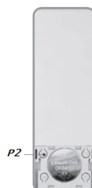
Кнопка настройки «P2» и отсек для батареи